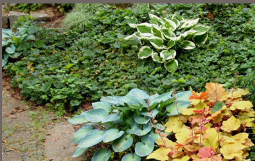
Hosta und Heuchera