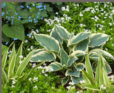
Hosta, Galium und Brunnera